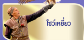
โชว์เหยี่ยว