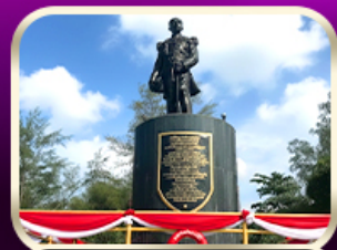
อนุสาวรีย์กรมหลวงชุมพรฯ