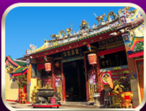
ศาลเจ้าแม่ลิ้มกอเหนี่ยว

ที่เที่ยวเพิ่มขึ้น และ ช่วยฟื้นฟูเศรษฐกิจขนาดใหญ่