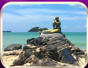
เที่ยวหาดสมิหลา สงขลา