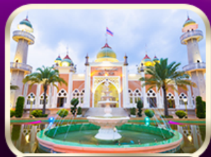
ชมมัสยิดกลางปัตตานี