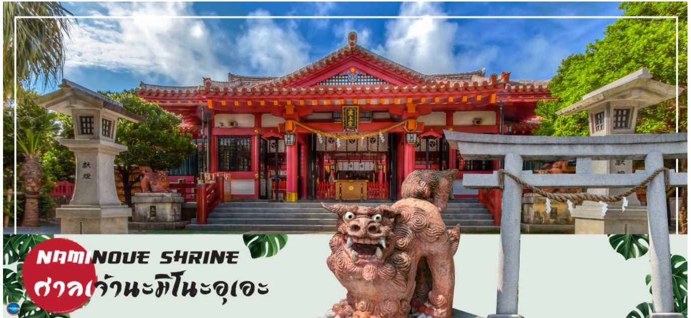
NAMINOUE SHRINE ศาลเจ้านะมิโนะอุเอะ

วันที่สี่ ศาลเจ้านามิโนะอุเอะ – ห้างสรรพสินค้า พาร์ค ซิตี้ – ทำอากาศยานนาสะ โอกินาวา – ทำอากาศยานดอนเมือง กรุงเทพฯ