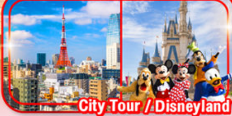
City Tour / Disneyland