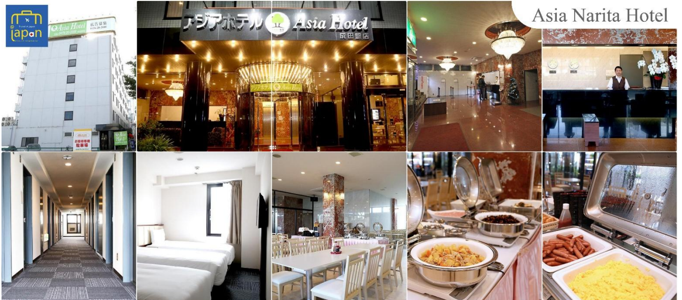
Asia Narita Hotel

พักที่ ASIA HOTEL NARITA หรือเทียบเท่าระดับเดียวกัน