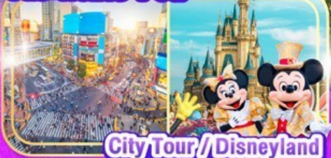
City Tour / Disneyland