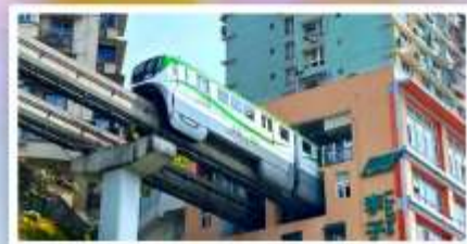
รถไฟฟ้าลัดดี