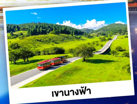
เจานางฟ้า