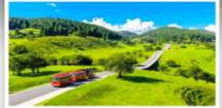
เหนานางฟ้า

เดินทางโดย: สายการบินฉงชิ่งเจียงเป่ย์ (PN)