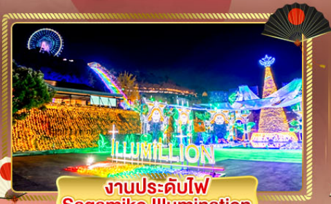
งานประดับไฟ Sagami Illumination