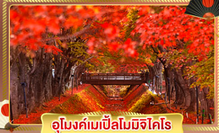
อุโมงค์เมเปิ้ลโมมิจิโคโร