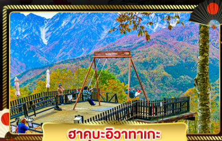
ฮาคุบะอิซากาตะ