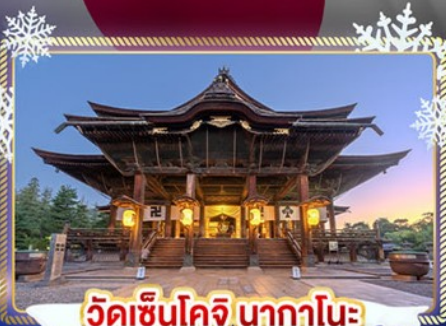
วัดเซ็นโคจิ นากาโนะ