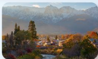
โออิเดะ ปาร์ค