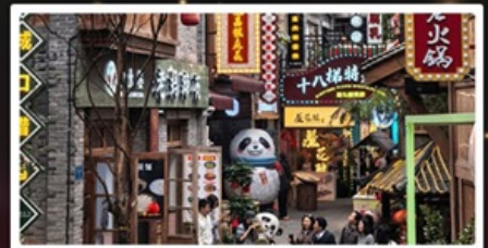
หมู่บ้านสี่पाती