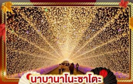
นอบานาโนะซาไต

"ชมความงามของฤดูใบไม้เปลี่ยนสี" เที่ยวครบจบทุกไฮไลท์ โอซาก้า-โตเกียว พิเศษ!! บันด์รูปแบบ FULL SERVICE