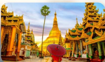
วัดจิ้งอัน