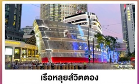
เรือหลุยส์วิตตอง