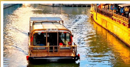
ลำเรือ Grand Canal