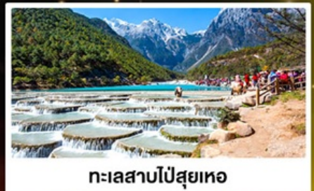
ทะเลสาบโป๋สือเหอ