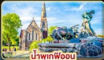
น้ำพุเทพอน