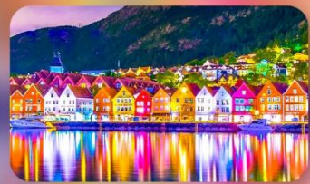
ฟักเบอร์เก้น 1 คืน