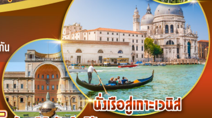
นั่งเรือสู่เกาะเวนิส