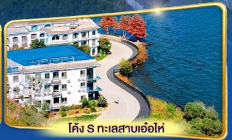
โค้ง S ทะเลสาบเอ้อไห่