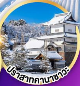
ปราสาทคานาซาวะ