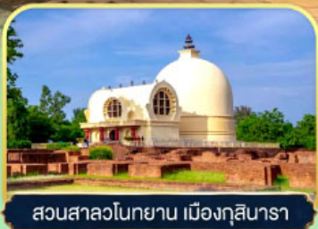
สวนสาละวินคยาณ เมืองกุสินารา