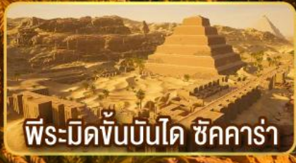
พีระมิดขั้นบันได ชัคคาร์่า