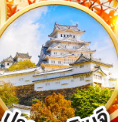
ปราสาทโอเมจิ