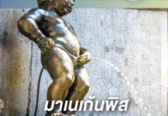
มานเนกันพิส