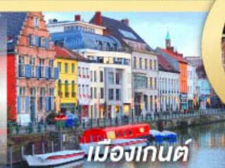
เมืองเกนต์