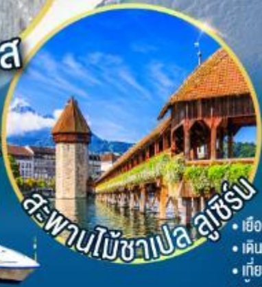
สะพานไม้ชาเปล ลูเซิร์น