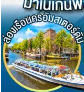
ล่องเรือนครอัมสเตอร์ดัม