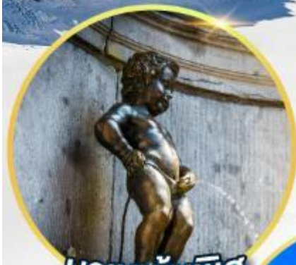
มานกันพิส