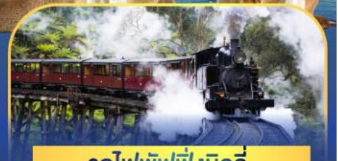
รถไฟพuffingบิลลี่

ล่องเรือชมอ่าวซิดนีย์พร้อมรับประทานอาหารกลางวัน และ เข้าชมสวนสัตว์การองก้า