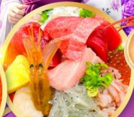
ตลาดปลาชิบิสึ คาชิโมะจิ