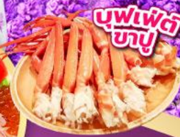
บุฟเฟ่ต์ ซาซู