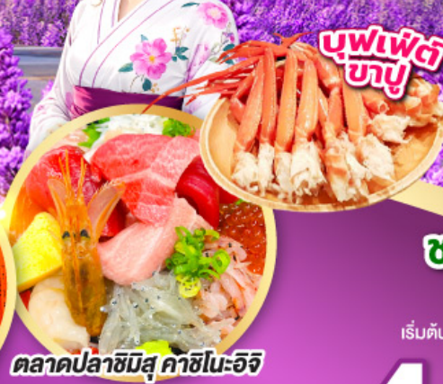
ตลาดปลาซิมิสึ คาชิโนะอิชิ