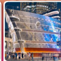
เรือหลุยส์