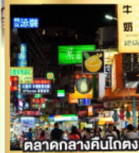
ตลาดกลางคืนโตง