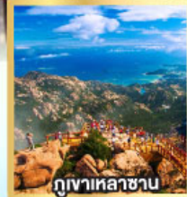
ภูเขาเหลาซาน