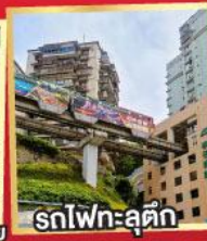
รถไฟฟ้า-ลูตึก