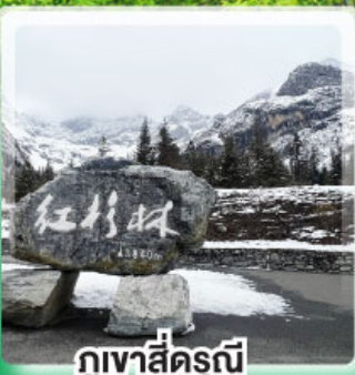
ภูเขาสิ่ครุณี