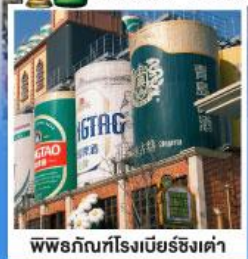
พิพิธภัณฑ์โรงเบียร์ชิงเต่า