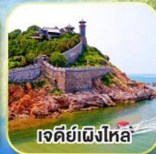
เจดีย์เฝิงไหล