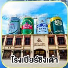
โรงเบียร์ซิงเต่า