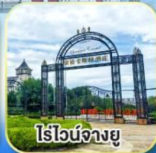
ไร่ไวน์จางยู