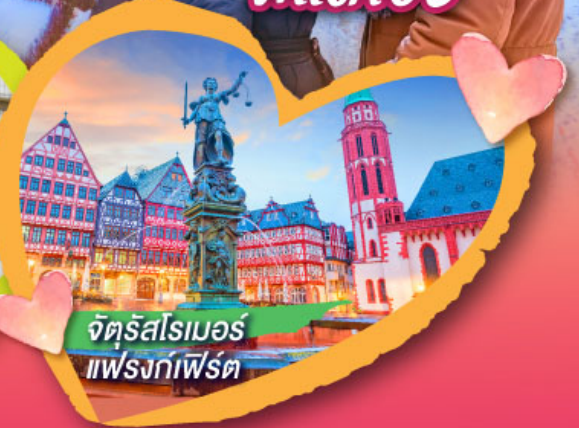
จัตุรัสโรเมอร์ แฟรงก์เฟิร์ต