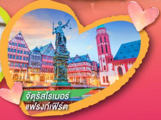
จัตุรัสโรเมอร์ แฟรงก์เฟิร์ต