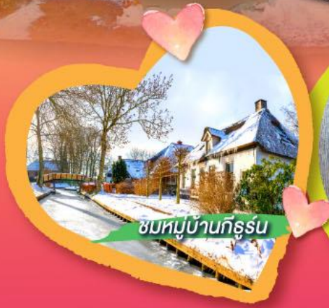
ชมหมู่บ้านกิธูรน