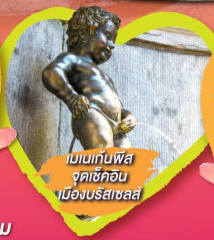
เมเนกันพีส จุดเซ็คอิน เมืองบรัสเซลส์