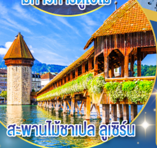
สะพานไม้ชาเปล ลูเซิร์น