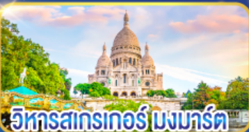
วิหารสตรกเกอร์ มงมาร์ต