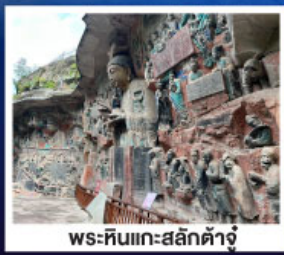
พระหินแกะสลักตัวจู้