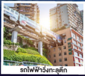
รถไฟฟ้าวิ่งทะลุคิก