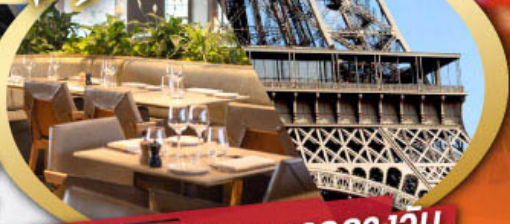
รับประทานอาหารกลางวัน บนหอไอเฟล

ไฮไลท์ในโปรแกรม • ถ่ายรูปคู่มือไอเฟลและพิพิธภัณฑ์ลูฟว์ • สะพานไม้ชาเปล ลูเซิร์น • ขึ้นกระเช้าสู่ยอดเขาจุงเฟรา • เมืองมรดกโลก กรุงเบิร์น • ถ่ายรูปปราสาทชิลยองที่มองเทรอซ์ • ศาลาไทย เมืองโลซานน์ • เดินเพลินๆ ณ เมืองเวเวย์