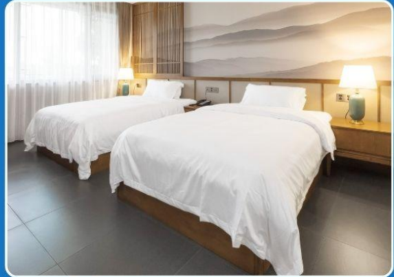
👤👤 TWIN (TWN)