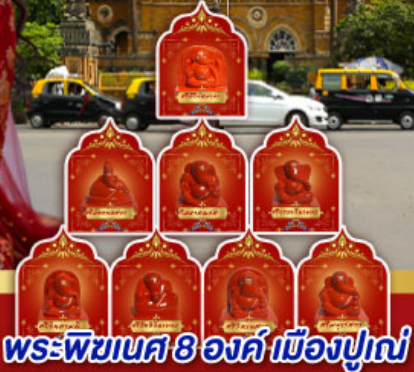
พระพิฆเนศ 8 องค์ เมืองปูณ