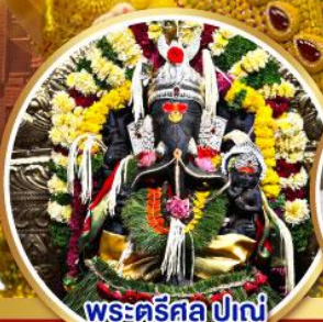
พระศรีศิว ปูणे (Trishul Pune)