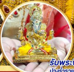
รับพระพิฆเนศวร ปางรำรอย ท่านละ 1 องค์