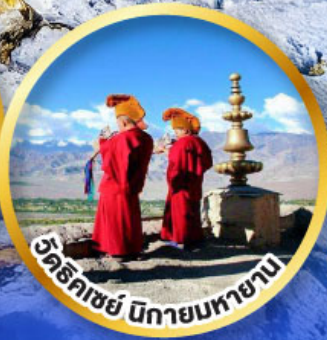
วัดริคชีย์ นิกายมหายาน