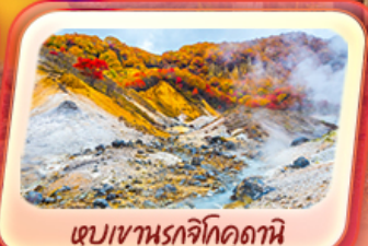
เขมเขานรกจิโศดามิ