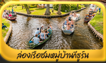
คลองเรือชมหมู่บ้านคีอูร์น