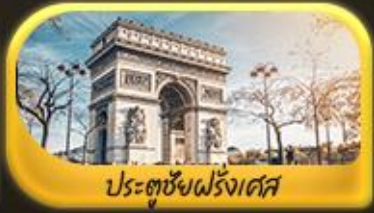
ประตูชัยฝรั่งเศส

พิเศษ!! ล่องเรือแม่น้ำแซนชมเมือง โดย บาโด บูช