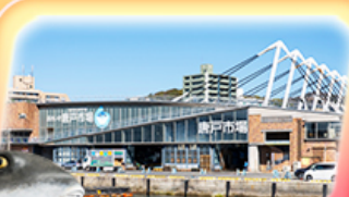
ตลาดปลาอาราโตะ