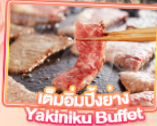
เค็มอบบิงย่าง Yakiniku Buffet