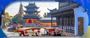
Zhujiajiao Ancient Town ส่องเรือเมืองโบราณ

เชียงใหม่ ดิสนีย์แลนด์ เมืองโบราณจูเจียเจียว