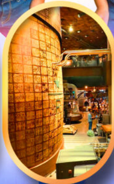
ร้านสตาร์บัคส์