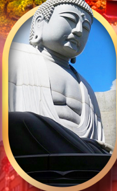
พระใหญ่อะตะมะ