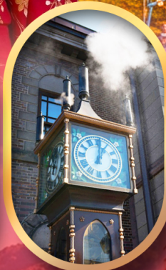
พิพิธภัณฑ์ถ้ำกลองดนตรี