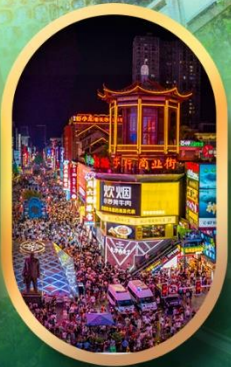
ถนนคนเดินซิงลู่