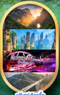
ฟรีคีย์เลือกซื้อ Option เสริม