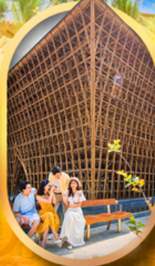
อาคารไม้ไผ่