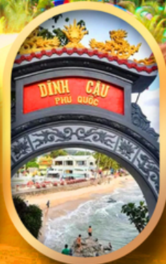
ศาลเจ้าดิงเกา