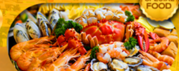
พิเศษเมนู ซิวัดบุฟเฟ่ต์ 11 มื้อ เดินทาง มีนาคม 2569