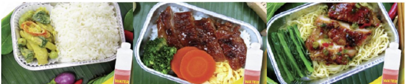
Green curry chicken with rice and water Chicken teriyaki with rice and water Chicken roasted with herb and noodle and water

*** เมนูอาหารอาจมีการเปลี่ยนแปลง ทั้งนี้ขึ้นอยู่กับเที่ยวบิน ***