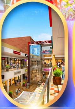
บิตซูเอาก์เล็ท