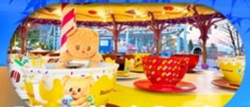
Fuji q Highland x Butterbear เดินทาง พ.ค. 69 เป็นต้นไป