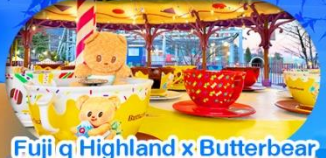
Fuji q Highland x Butterbear เดินทาง พ.ค. 69 เป็นต้นไป