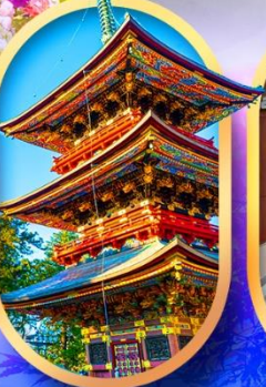
วัดนาริตะ-ซัน