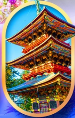
วัดนาริตะเซ็น