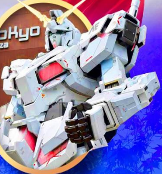
ห้างไอโดปะกับดัม