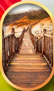
หุบเขาจิกุกดาบิ