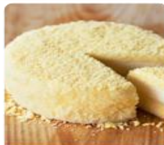
ร้าน YAMAOKA ร้านนี้ผลิตขนมอร่อย ด้วยบรรยากาศในร้านสวยแสงสีอบอุ่นที่แสนอบอุ่น อีกกล่องด้วยเพลงสากลแบบอิตาลี