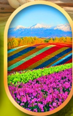
สวนดอกไม้ชิชิโซ